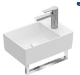
Handwaschbecken WC: Villeroy&Boch Memento 2.0 Armaturen ident WT Anlage im Bad