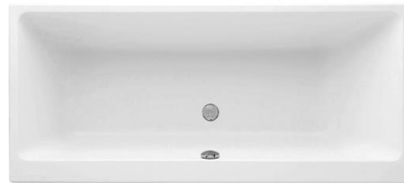
Badewanne Villeroy&Boch Subway Acryl 180/80