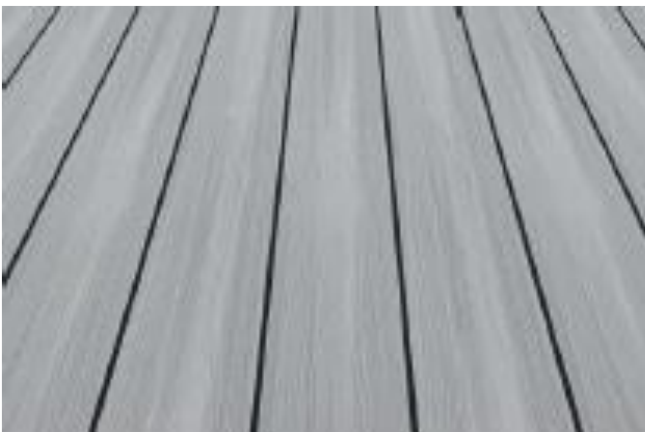
WPC Fano Ultrashield – silbergrau