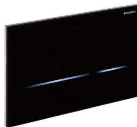
Geberit Betätigungsplatt Sigma 80 berührungslos