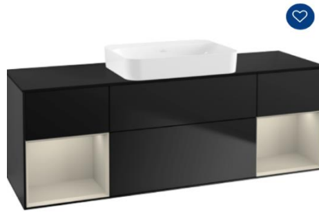
WT Unterbauschrank Serie Villeroy&Boch Fineon