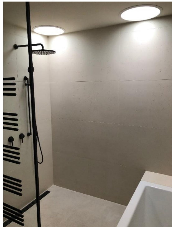
Wand- und Bodenfliesen: l'argilla, Loft Ivory