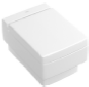
WC Villeroy&Boch Mement