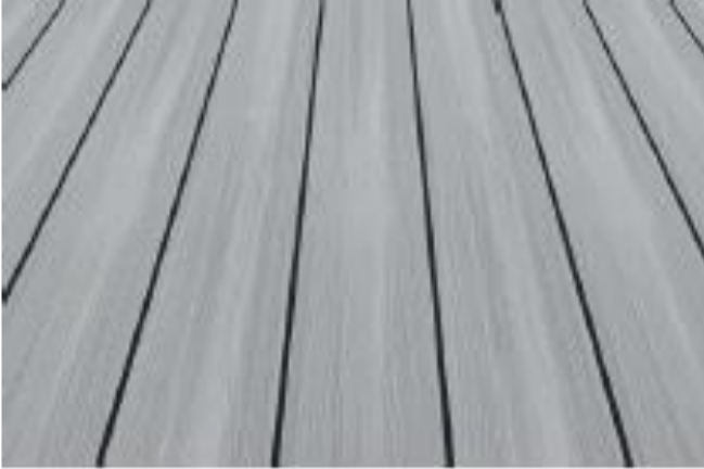
WPC Fano Ultrashield – silbergrau