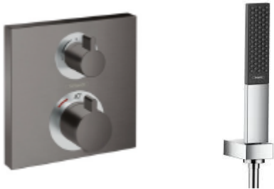
Armatur Wannen und Duschen: Hansgrohe EcostatSquare Schwarz matt Hansgrohe Rainfinity Stabhandbrause schwarz matt