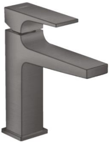
WT Armatur Hansgrohe Metropol Einhebel WT Mischer Schwarz matt