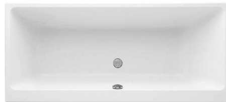
Badewanne Villeroy&Boch Subway Acryl 180/80